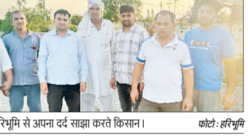
रोहताक। हरिभूमि से अपना दर्द साझा करते किसान।

शाम होते ही खेतों में पसरा सन्नाटा, सुबह लहलहा रही थी पकी हुई फसल अमरजीत एस गिल। रोहताक