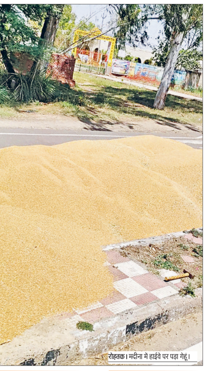
रोहताक। मदीना में हाईवे पर पड़ा गेहूं।

मार्केट कमेटी रोहताक द्वारा लाखन माजरा और मदीना में गेहूं खरीद केंद्र बनाए गए हैं, ताकि किसानों को दूर अनाज मंडियों में गेहूं को न लेकर जाना पड़े। लेकिन विडंबना यह है कि इन खरीद केंद्रों में अबस्था के चलते गेहूं की बेकद्री हो रही है। खरीद केंद्र के लिए पर्याप्त जगह न होने की वजह से आदतियों द्वारा गेहूं सड़कों, खेतों और प्लांटों में डालना पड़ रहा है। ये खरीद केंद्र महज डेढ़ या दो एकड़ जमीन में ही चलाए जा रहे हैं। जबकि खरीद केंद्र के लिए कम से कम दस एकड़ जमीन होनी चाहिए। जो काम दस एकड़ जमीन में होना है, यदि वह दो एकड़ में किया जाए तो अव्यवस्था होना लाजमी है। मदीना खरीद केंद्र की जमीन महज दो एकड़ है।