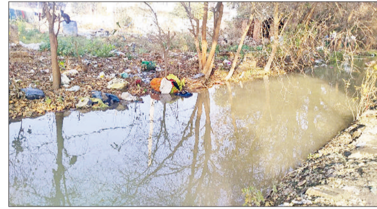
रोहतक। इस तरह से ओवरपलो होकर चलता है जलघर की तरफ जाने वाला रजवाहा।

सोनीपत रोड रजवाहे पर प्रस्तावित 3.5 किलोमीटर लंबी पाइपलाइन का निर्माण कार्य सात साल बाद भी अधूरा पड़ा है। यह प्रोजेक्ट शहर की जल आपूर्ति को मजबूत करने के लिए शुरू किया गया था, लेकिन आज भी ठंडे बस्ते में है। हैरानी की बात यह है कि इस परियोजना को लेकर चंडीगढ़ में चार बार बैठकें हो चुकी हैं, बावजूद इसके काम सिर नहीं चढ़ पाया। कार्यवाही संस्था द्वारा लगभग 30 प्रतिशत कार्य पूरा कर लिया गया था, जिसके एवज में करीब 55 लाख रुपये का भुगतान भी किया जा चुका है। लेकिन शेष 70 प्रतिशत कार्य अधूरा होने के कारण इसका खामियाजा सेक्टर-3 समेत आसपास के क्षेत्रों के निवासियों को भुगतान पड़ रहा है। मानसरोवर पार्क के सामने स्थित प्रथम जलघर के टैंकों तक जेएलएन (जवाहर लाल नेहरू नहर) से मिलने वाला पानी सामान्य से चार गुना कम पहुंच रहा