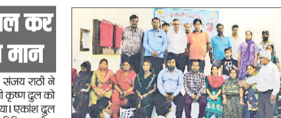
रोहतक। चयनित छात्र-छात्राओं के साथ ट्रस्ट के पदाधिकारी।