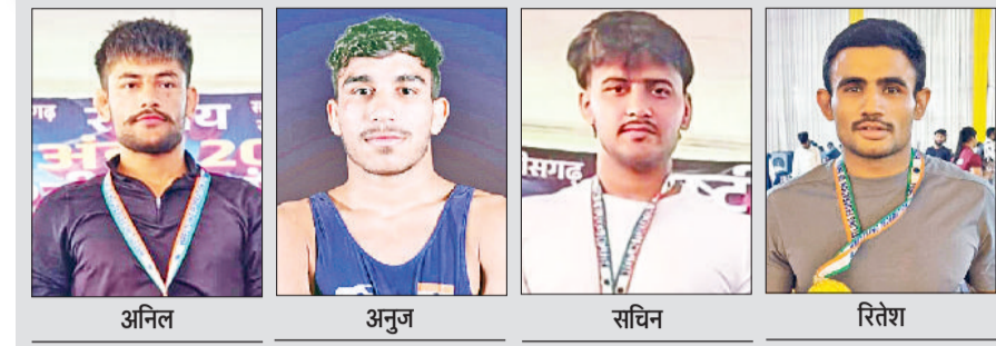
हरिभूमि न्यूज ▶▶ रोहतक

20वीं नेशनल कुश्ती चैंपियनशिप (ग्रीको-रोमन) में हरियाणा के पहलवानों ने सर्वश्रेष्ठ दमखम दिखाते हुए पदकों की बाँछार कर दी। हरियाणा ने इस प्रतिष्ठित प्रतियोगिता में कुल 10 पदक जीतकर प्रदेश का नाम रोशन किया है। टीम के जांबाज पहलवानों ने 7 स्वर्ण, 2 रजत और 1 कांस्य पदक अपने नाम किए। फाइनल मुकाबलों में हरियाणा के खिलाड़ियों ने प्रतिद्वंद्वियों को चित करके हुए तकनीकी श्रेष्ठता और अदृष्ट मानसिक शक्ति का परिचय दिया। यह प्रतियोगिता छतसगढ़ में